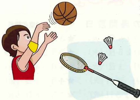
毎週バスケットボールを楽しむ若者グループ